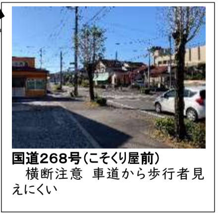
国道268号(こそり屋前) 横断注意 車道から歩行者見えにくい

他にも気付かれた危険箇所がありましたら、学校まで御連絡ください！ 学校HPで随時更新していきます！ (右のQRコードから大口小HPに入り、マップを見てください)