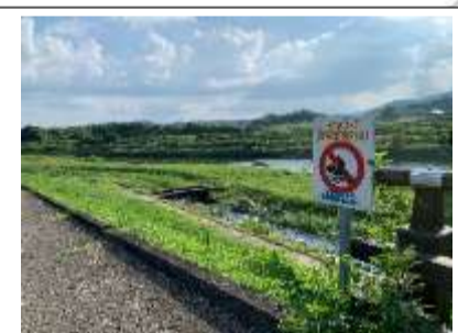
羽月川(轟公園) 遊泳禁止区域であって、特に堰付近は注意