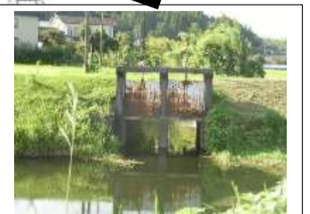
水門(水之手川) 釣り等、遊び時の転落の危険あり