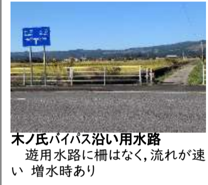
木ノ氏バイパス沿い用水路 遊用水路に柵はなく、流れが速い 増水時あり