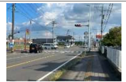
国道267号・268号 普段から交通量が多く大型車も通る