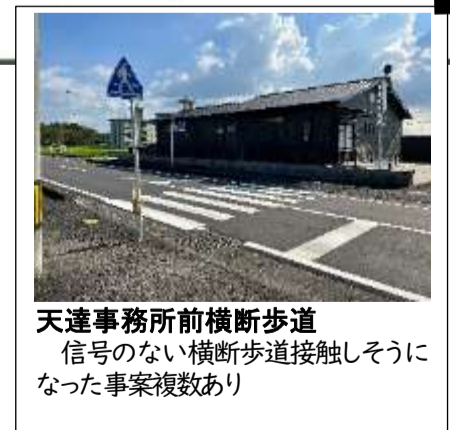
天達事務所前横断歩道 信号のない横断歩道接触しそうな事案複数あり