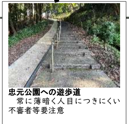
忠元公園への遊歩道 常に薄暗く人目につきにくい 不審者等要注意