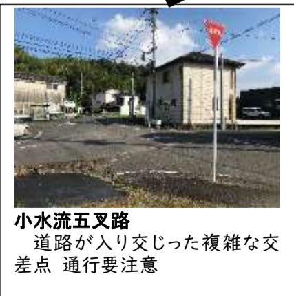
小水流五叉路 道路が入り交った複雑な交差点 通行要注意