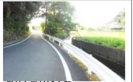
学校と反対城山麓 用水路があり危険 過去に不審者情報あり