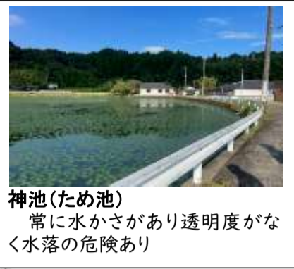
神池(ため池) 常に水かさがあり透明度がなく水落の危険あり