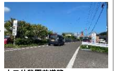
大口幼稚園前道路 幼稚園送迎等の車両が多く通行要注意